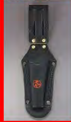
モンキーレンチなど ラチェット・ペンチなど