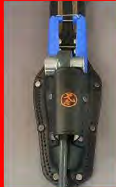
ミニカッター ラチェットレンチなど