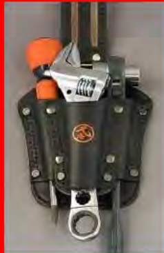
モンキーレンチ ラチェット・ドライバーなど