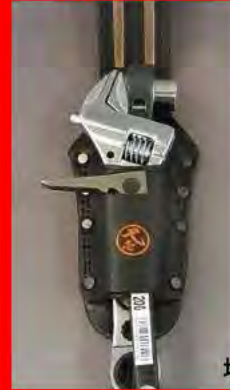
モンキーレンチなど ラチェット・小バールなど